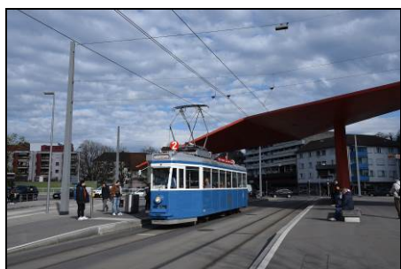
Revidierter Pedaler in Schlieren

"Pedaler" genannt, ist seit dem 5. April 2022 nach erfolgter Revision wieder voll betriebsfähig im Bestand der TMZ-Museumswagen. Seit diesem Tag steht er im Tram-Museum Burgwies im vorersten Glied und ist bereit für kommende Fahrten.