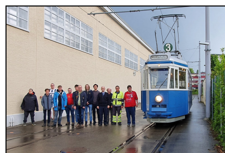
Ausfahrt für Trampflegeteam

Mit grosser Freude durften wir am diesjährigen Trampflegetag, an dem im Museum Burgwies unsere Preziosen manuell gereinigt werden, einige Jugendliche begrüßen, welche an der Fahrt mit dem Tram 2000 auch dabei waren. Dies zeigt uns, dass wir mit der TMZ Jugend auf dem richtigen Weg sind. Wie gewohnt durften das Pflege-Team nach getaner Arbeit eine Ausfahrt mit einem der historischen Fahrzeuge genießen.