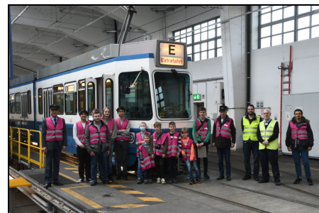
TMZ Jugend vor dem Be 4/6 2005 im Depot Irchel