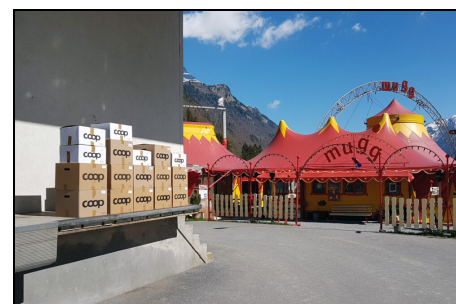
Archivmaterial in Betschwanden

gesichtet, reduziert und auf die beiden Standorte Triemli und Betschwanden verteilt werden. Der Verein wird sich künftig primär auf die Archivierung zum Thema öffentlicher Verkehr in der Stadt und im Kanton Zürich beschränken.