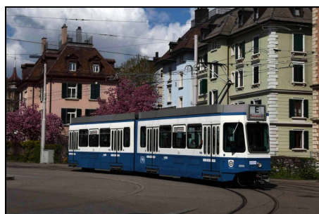
Zukünftiges Museumsfahrzeug Tram 2000 Be 4/6 2005

Nach einem weiterführenden Gespräch mit zwei Vertretern der VBZ wurde uns im Herbst 2021 zugesagt, dass zumindest je ein Tram 2000 der ersten und zweiten Serie in den Bestand des Tram-Museums aufgenommen wird.