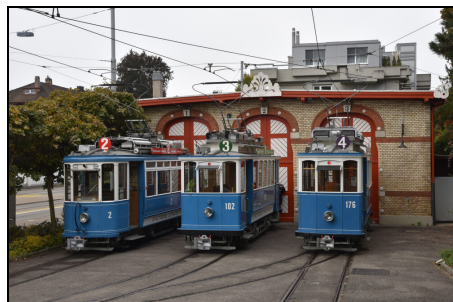
Historische 2-Achs-Trams mit ausstehenden Revisionen

Bei drei betriebsfähigen Zweiachs-Motorwagen ist die Revision noch ausstehend. Die VBZ haben dem Verein erfreulicherweise in Aussicht gestellt, dass bei vorhandener Kapazität noch in diesem Jahr die Revision von einem weiteren Fahrzeug in Angriff genommen werden sollte. Für den Verein steht die Revision des StStZ Ce 2/2 2 im Vordergrund, da dieses Fahrzeug einerseits vielseitig einsetzbar ist und andererseits der erste vom Verein restaurierte Tram-Motorwagen war.